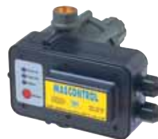
MASCONTROL pour puissance jusqu'à 2,2 kW