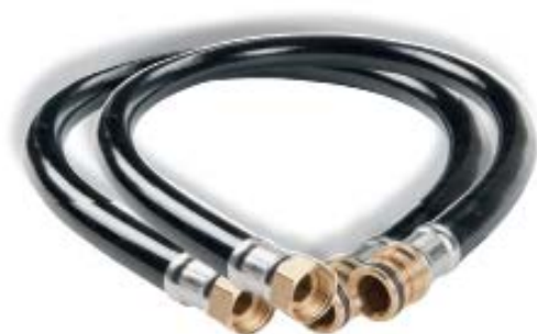
2 FLEXIBLES «CLIP STYLE»