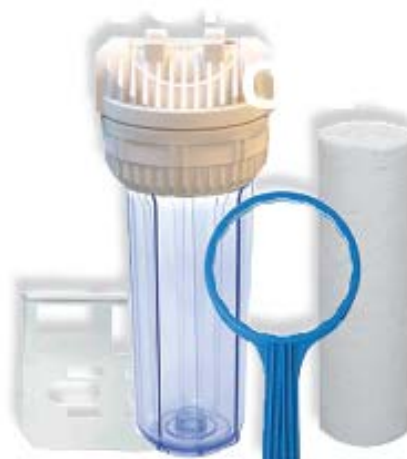
UN KIT DE PRÉFILTRATION 10 MICRONS